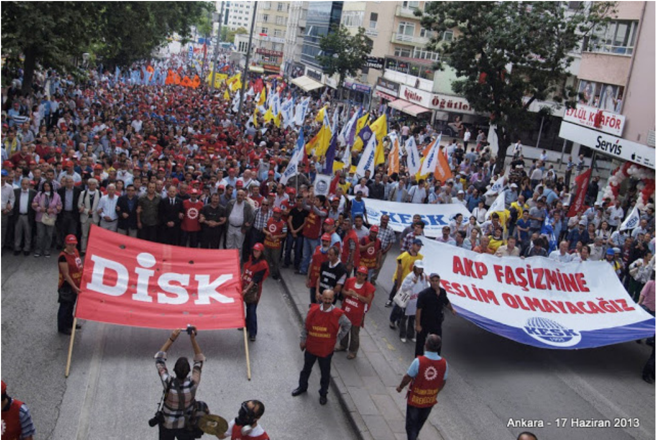
Ankara - 17 Haziran 2013

TKP Üyeleri, işçi-sendika hareketinin yaratıcısı ve devamcısı olarak; yukarıda saydığım durumun vahametini kavramalı, bu durumu değiştirebilecek tek geleneğin temsilcileri olmanın sorumluluğuyla, sınıf içinde yürüttüğümüz çalışmayı bugünlerde yaşadığımız yığın hareketlerinin dersleriyle bir kez daha değerlendirmelidir. Yığın hareketinin bize öğrettiklerinin ışığında İ. Bilen öğretmenimizin bize öğrettiği “fabrikalar kalemizdir” şiarıyla bir adım öne çıkmalı, yeni mevziler kazanmalıyız. Bizlerin kararlı, yaratıcı savaşımımız sonucunda, işçi hareketine musallat olan “sosyal diyalog” sendikal anlayış ve sendikal bürokrasiyi yenilgiye uğratabiliriz.